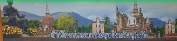
สำนักงานสาธารณสุขจังหวัดสุโขทัย